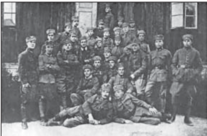
Учасники підстаршинських курсів у Розвадіві Жидачівського пов.