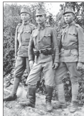
Українські січові стрільці. Поділля, 1916 р.

(За волю України: Історичний збірник УСС. 1914–1964 / За ред. С.Ріпецького. — Нью-Йорк: Червона Калина, 1967. — С. 418).