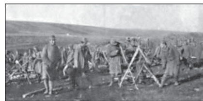
Легіон УСС над Стрипою

(За волю України: Історичний збірник УСС. 1914–1964 / За ред. С.Ріпецького. — Нью-Йорк: Червона Калина, 1967. — С. 417–418).