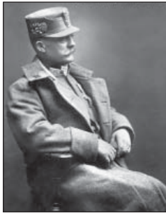
Отаман Мирон Тарнавський