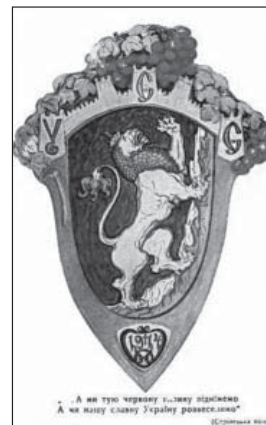
Поштова листівка, видана Пресовою кватирою УСС. Малюнок О. Новаківського, 1918 р.

Останні й досі не можуть забути січових лицарів та їх найбільшої «провини» — боротьби за самостійну Україну. Так, ще не встигло висохнути чорнило на Указі Президента України Віктора Ющенка «Про заходи з відзначення, всебічного вивчення та об'єктивного висвітлення діяльності Українських січових стрільців» від 6 січня 2010 р. 1 , як Москва, сполошившись, тут же вирішила повчити Україну історії. Традиційно не переймаючись такими «дрібницями», як втручання у внутрішні справи іншої держави, вона вустами спікера Держдуми Російської Федерації Бориса Гризлова заявила: «Це не перший недружній крок українського президента, який через політичну кон'юнктуру продовжує нав'язувати курс на перегляд спільної історії» 2 .