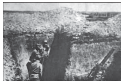
Міномет у стрілецьких окопах на позиції «Весела» на Тербовлянщині

2. Від дня 18-го вересня лучається вже другий случай підозріння про червінку. Заразки находяться в людських відходах, тому належить звертати