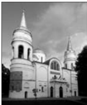
Спасо-Преображенський собор у Чернігові.