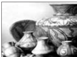
Кераміка трипільської культури