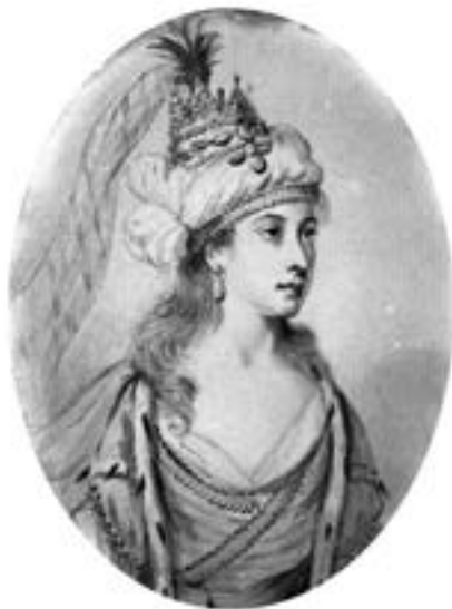
Роксолана. Е. Мартін. XVIII ст. Акварель. 13×10 см. Приватна колекція

не дивно, що через свій незвичний навіть для слов'ян тип краси Роксолана впала в око султанові Сулейману, якому належало 300 одалісок у гаремі 33 .