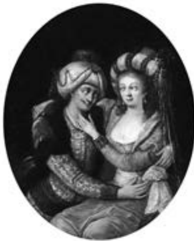
Сулейман і Роксолана. Невідомий французький художник XVIII ст. 28,5×23,5 см. Приватна колекція

Абрахамович 79 . А 1920 року український живописець та художній критик Олекса Грищенко, який побував у Стамбулі в гробниці Роксолани, у своєму щоденнику мандрівника зазначив, що вона була зі Західної України, з Рогатина 80 . Тож практично нема сумнівів: Роксолана походить саме з Рогатина, що на Прикарпатті.