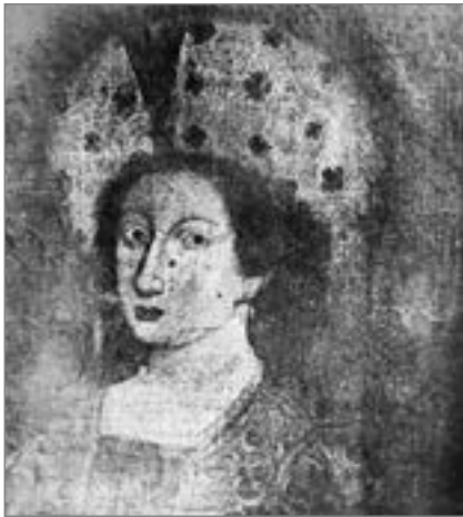
Роксолана у крпчастому беремі. Невідомий автор. Uluçay M.Ç. Osmanlı Sultanlarına Aşk Mektupları. — İstanbul: Şaka matbaası, 1950. — S. 7

Посол Священної Римської імперії Ож'є Гіслен де Бусбек у «Турецьких листах» зазначив, що Махідеван родом із Криму 19 . Адже її батьківщиною можна вважати Тамань, що відокремлена від півострова Керченською затокою, яку за старих часів латиною називали Bosphoro Cimmerio . У Махідеван було ще одне ім'я — Босфоріана 20 або Босфор 21 . 1508 року її 11-річною дівчинкою перевезли до османського палацу, де на неї чекав шехзаде Сулейман. Разом вони відбули до Криму на три роки. Саме там за Малхуруб закріпилося ім'я Бахарай («Весняна», «Весняний місяць»). У гаремі Сулеймана її за незрівнянну красу ще називали Гюльбахар («Весняна троянда») та Махідеван 22 .