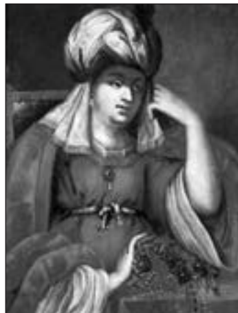
Роксолана. Невідомий польський художник. Друга пол. XVII ст. Домініканський монастир при базиліці Св. Трійці у Кракові (Польща)

Але мені під час написання книжки «Роксолана: міфи та реалії» пощастило виявити давніші спогади. На двадцять п'ять років раніше за Твардовського, тобто 1596-го, схожу інформацію про « попівну з Рогатина з народу русинського » залишив у доповідній великому канцлерові Великого Князівства Литовського Льву Сапезі (Leon Sapież) секретар короля Стефана Баторія, Станіслав Негощевський. Під псевдонімом Крістофіно Демінео Перегрін Полонус (Peregrino Polono Christophino Daminaeo) він занотував, що подібне стверджував онук Роксолани та султана Сулеймана — Мурад III 78 . Його слова як доказ русинського походження цієї султани навів у «Польському біографічному словнику» відомий польський османіст, професор Зигмунт