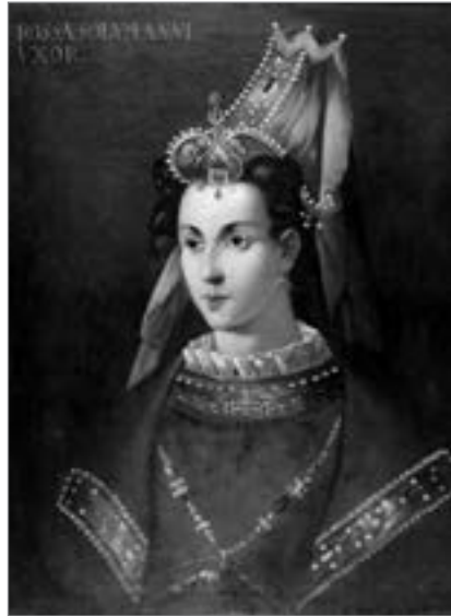
Роксолана. Невідомий художник. XVII ст. 83×67. Музей палацу Топкапи, TSM 17/141

Сумніви у цьому посіяли її портрети роботи невідомих художників. Один з них зберігається у музеї Флоренції (галерея Уффіці), його мініатюрна копія — у Відні (Музей історії мистецтв). На ньому Роксолана зображена у профіль із приспущеним прозорим яшмаком (чадрою) 39 . І тут її ніс не можна назвати кирпатим, радше — продовгуватим і з горбочком. Те саме стосується й зображення Роксолани у крапчастому береті, яке оприлюднив турецький історик М. Ч. Улучай, та її образу пензля німецьких художників — майстра ребусів Ерхарда Шьона і гравера Ханса Зебальда Бехама. Два останні зображення було створено на основі портрета Роксолани Міхаеля Остендорфера, намальованого 1548 року на замовлення італійського історика Паоло Джовіо 40 . Схожий на цю серію портрет Роксолани невідомого автора 41 , що також зберігається у флорентійській галереї Уффіці, є, найімовірніше, авторською інтерпретацією двох попередніх її зображень. Адже на ньому олійними фарбами намальована жінка — темноволоса й похмура.