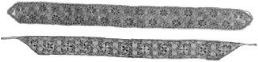
Каишбашти Роксолани. Музей палацу Топкапи TSM 31/1478, 31/1480

з його гарему було видалено інших жінок. Ідеться, зокрема, про матір Ювейса-паші, який був зведеним братом сина Айше Хафси, Сулеймана 3 . Коли вона завагітніла, Селім чомусь видав її заміж. Ім'я цієї жінки не збереглося до наших часів. Недовго в його гаремі перебувала й інша наложниця — найулюбленіша дружина шаха Ісмаїла, Тачли-хатун, яку османи полонили під час битви на рівнині Чалдиран 1514 року. Її видали заміж за казаскера Анатолії Таджізаде Джафера-бея 4 . Невідома доля й іншої наложниці Селіма, яка народила йому під час перебування у санджаку Трабзон сина Саліха та, можливо, доньку Камер-султан. Вони, як й інші троє синів Селіма (Орхан, Мурад та Коркуд) 5 , померли у дитинстві близько 1503 року і поховані у Трабзоні в саду музею Св. Софії 6 . Можливо, їхню матір також відправили з гарему Селіма, бо про неї нема жодних відомостей у комирних книгах палацу Маніси, до якого після Криму переїхала Айше Хафса зі шехзаде 7 -престолонаступником Сулейманом, та Старого й Нового палаців Стамбула. Лише матір зведеної сестри султана Сулеймана, Шах Іхубан-султан, залишилася в гаремі Селіма I Явуза й до смерті мешкала у Старому палаці 8 . Можливо, вона була донькою кримського хана Менглі I Гірея на ім'я Айше, яку майбутній султан Селім I Явуз пошлюбив 1511 року 9 .