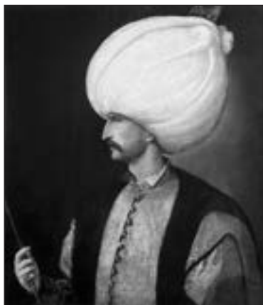
Султан Сулейман Пишиний. В. Тиціан. 1539 р. 99×85 см. Музей історії мистецтв. Відень (Австрія). №2429