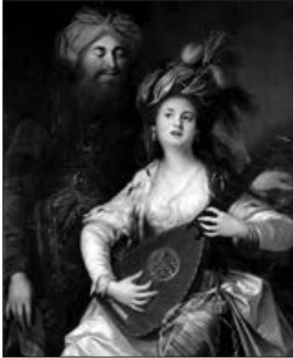
Сулейман і Роксолана. К. А. Хакель. 1780 р. 129,5×89 см. Приватна колекція