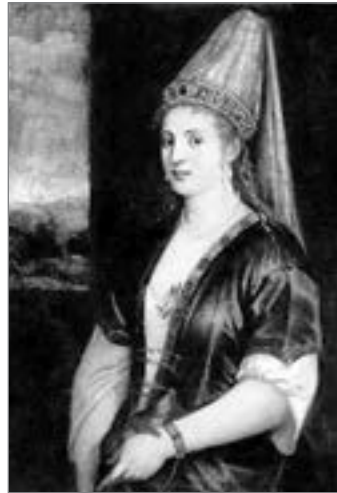
Роксолана (Султана Росса). В. Тиціан. 1550-х рр. 97х76 см. Музеї художнього та циркового мистецтва братів Рінглінг у Сарасоті (США). №SN58

У вашингтонській галереї мистецтв є інша робота Тиціана — «Портрет леді». Зображена на ньому жінка як дві краплі води схожа на ту, котра дивиться на нас із портрета «Султана Росса». Тому можна припустити, що це також Роксолана. Щоправда, тут вона без коштовних прикрас у зеленій (священній для мусульман колір) сукні з вінком із польових квітів на світло-рудому пишному волоссі та червоним яблуком у руці — символом плодovitості жінки, адже Роксолана