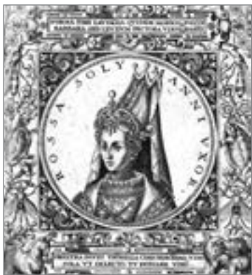
Роксолана. Т. де Брі. Vitae Et Icones Sultanicorum Tvrnicorum, Principum Persarum aliorumq[ue] illustrium Heroum Heroinarumq[ue] ab Osmans usq[ue] ad Mahometem II. Ad vivum ex antiquis Metallis effictae, primum ex Co[n]stati[n]opoli D. Imp... Civem Francforti, 1596. — S. 206