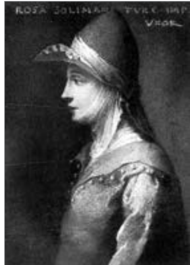
Роксолана (копія). Невідомий автор. Музей історії мистецтв. Відень