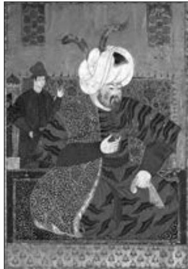
Шехзаде Селім з чаркою та хусткою у руках. Нігарі. 1561–1562 рр. Колекція принца Садруддіна-аги хана. ТМ. 5

Про те, що Роксолана була таки русинкою, згадували венетійські послы в Османській імперії XVI століття П'єтро Брагадін 68