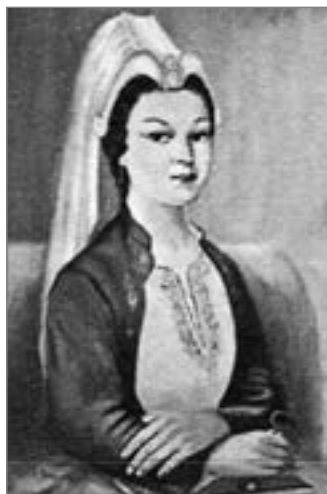
Портрет Айше Хафси. Турецький художник ХХ ст. М.А. Сагунер

Зауважимо, що листи своєму чоловікові, султанові Селіму I Явузу (Грізному), надсилала і його дружина Айше Хафса 2 . З її появою у житті Селіма