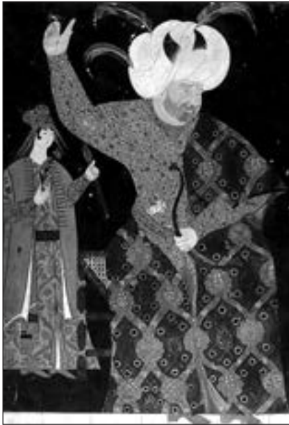
Шехзаде Селім стріляє з лука. Нізярі. 1561–1562 рр. TSM. Н. 2134. — Арк. у3

З огляду на це можна дійти висновку, що Роксолана була освіченою жінкою, вивчила не лише східні мови та Коран, а й, як і її чоловік, султан Сулейман, цікавилася поезією, історією та давньогрецькою міфологією. Разом з тим, у листах писала йому чуттєві вірші — рубаї і газелі. Вони, як свідчать турецькі мистецтвознавці, за майстерністю та художньою цінністю не надто поступаються творам Мухіббі (у перекладі з фарсі — «закоханий»), тобто Сулейману,