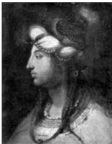
Роксолана. Невідомий автор. Галерея Уффіці. Флоренція (Італія)

й ув'язнили. Згодом фараон виправдав невинуватого чоловіка, наділивши його за всі заслуги державною владою.