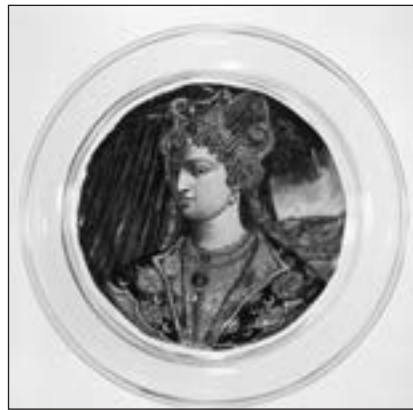
Портрет Роксолани на венеційському посуді XVI ст. Венедикт Мітте. Королівська колекція будинку Віттельсбах. Баварський національний музей. № G 553

Її листи почали «дихати» квітучою, барвистою мовою, якою вона щебетала, немов соловейко, не лише про кохання, а й про релігійні та політичні справи 51 . Так, не раз у своїх листах Хюррем, називаючи прекрасним лице султана, згадувала Юсуфа, який, за коранічними текстами, вирізнявся від інших людей надзвичайною красою 52 . У збірнику хадисів Мусліма йдеться про те, як пророк Магомет під час сходження на небеса дарував йому половину краси Адама, якого Аллах створив Своєю рукою, і надав йому найдосконалішого і найпрекраснішого вигляду. Від пророка Юсуфа божеволіли жінки, і він, щоб їх не спокушати, був змушений прикривати своє прекрасне обличчя накидкою. Проте одна жінка: дружина намісника фараона — у Корані; Потифара або ж Пентефрія — у Біблії, виявилася наполегливішою у своїх домаганнях. Вона намагалася його звабити, однак той опирався спокусі. Розгнівана жінка звела на юнака наклеп, звинувативши його у спробі згвалтування. Її задум спершу мав успіх: Юсуфа засудили