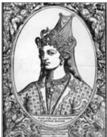
Роксолана. М. Пагані. 1540–1550 рр. Британський музей. №1878,0713.4166

Брюнеткою Роксолана виглядає на портреті XVII століття роботи невідомого венеційського художника з експозиції музею палацу Топкапи. На ньому вона — в одязі з широкою сорочкою без декольте, схожому на той, що носили османські жінки при надії. Можливо, тут її зображено вагітною. Прикметно, що такий самий одяг можна побачити на гравюрі Роксолани Теодора де Брі (1596 рік), з якої і було написано портрет із Топкапи. Темноволосою цю султану зобразили й на портреті з приватної колекції стамбульської родини Амрама. На ньому вона дуже схожа на зображення доньки Міхрімах італійської художниці XVI століття Софонісби Ангісоли.