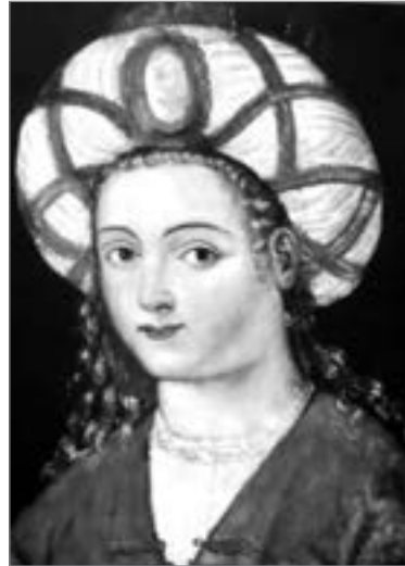
Роксолана. Невідомий автор. 38×26 см. Львівський історичний музей, №1496

Прикметно, що Роксолану в гаремі султана Сулеймана не вважали красунею, адже тоді славилися чорноброві, з великими карими очима, довгими віями, дугоподібними бровами, густим чорним волоссям та пишними формами наложниці 32 . Руденька, тендітна, невисока дівчина відрізнялася від східних красунь — зазвичай черкесок та грузинок. Її зовнішність була на той час, безперечно, викликом традиції. Тож