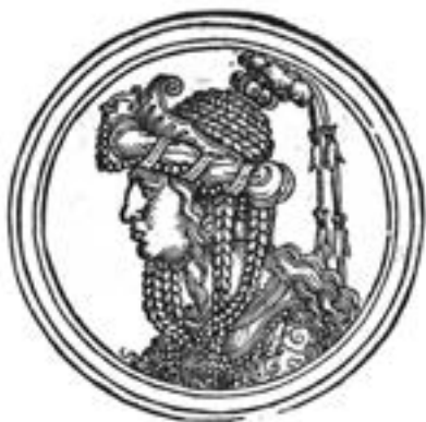
Роксолана. Ханс Зебальд Бехам. 1530 р. Університетська бібліотека, Ерланген-Нюрнберг