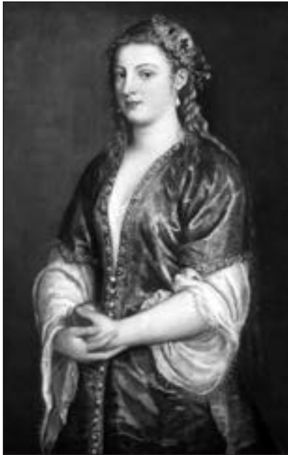
Портрет леді. В. Тиціан. 1550-х рр. 97×74 см. Музеї художнього та циркового мистецтва братів Рінглінг у Сарасоті (США). №SN58

народила султанові Сулейману щонайменше шестеро дітей.