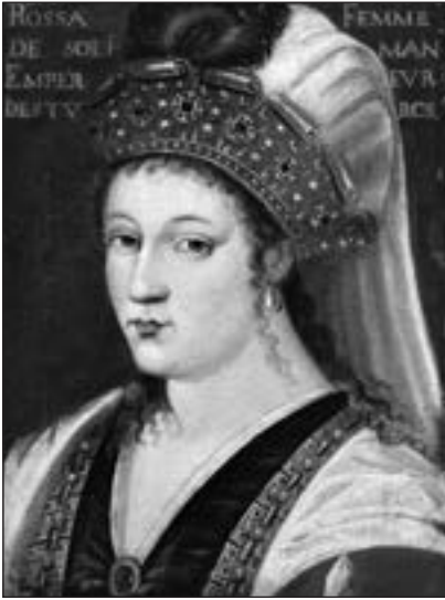
Роксолана. Невідомий автор. 49,3 × 36,8 см. Колекція британської монаршої сім'ї. Лондон (Англія). Palace of Holyroodhouse № RCIN 406152

із матір'ю, котра керувала його гаремом, і наставниками до провінцій Османської імперії, де вони мали набратися досвіду управління державними справами. У списку речей, що надали шехзаде Мустафі для правління у Манісі, було 400 тис. акче ($1 млн. 200 тис.) на місячні витрати, чимало харчів — м'ясо, масло, мед, цукор, червоний та чорний виноград, інші фрукти та овочі й свічки, а також розкішні шати, посуд, свічники, більше сотні наметів для нього і його свити (пашів, ічоланів, тобто пажів, музик і кухарів) 60 .