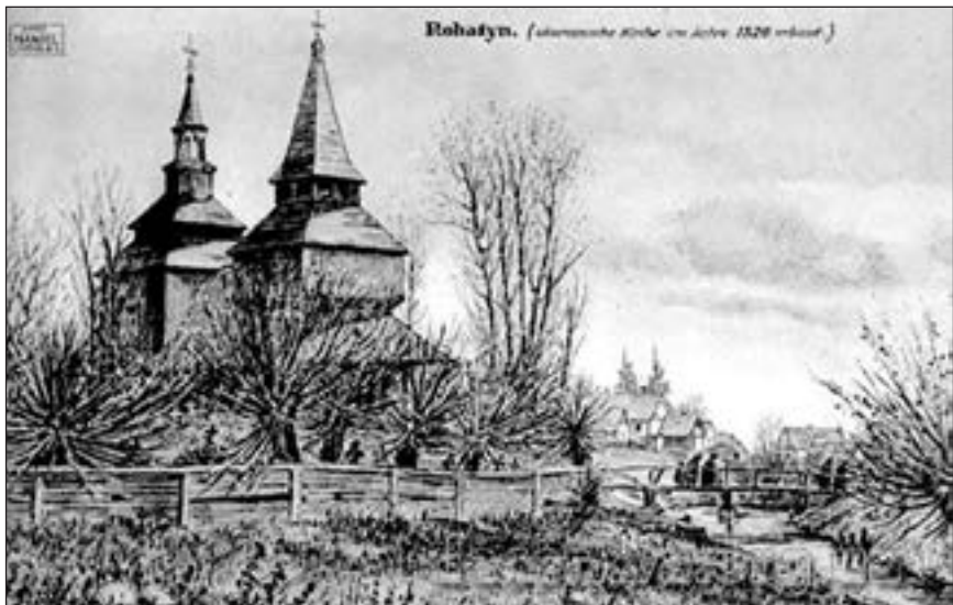
Церква Св. Духа в Рогатині. Листівка XIX ст. Із сайту спільноти «Рогатинщина»

і Даніелло Людовічі 69 , а також французький посол у Венеції Гуеллямо Пелісьє, який 1540 року інформував свого короля, що Роксолана походила з руського народу, який живе «від Карпатських гір аж до Борістена й Понта Евксінського» 70 , тобто від Карпат до Дніпра й Чорного моря. У ранній юності вона потрапила в полон кримських татар, які привезли її до Стамбула та подарували султанові Сулейману на честь його сходження на трон 71 . Подейкують, що до того, як потрапити до султанського гарему, вона перебувала у маетку тітки султана Сулеймана, Ханчерлі Фатьми 72 . Ця султана була донькою сина Баязида II, шехзаде Махмуда, і мешкала в палаці на березі Золотого Рогу, в районі мечеті Еюба. Ханчерлі Фатьма вийшла заміж за Мехмеда-бея 73 , сина великого візира Чандарлі Ібрагіма-паші. Вона була освіченою та впливовою жінкою. В архівах музею палацу Топкапи зберігається написаний великому візирові її лист, в якому вона повідомляла про безправ'я і хабарництво в суді. Йдеться про розгляд справи, в якій згадане ім'я Міхріхан — доньки Айше-султан, онучки султана Баязида II 74 . Відомо,