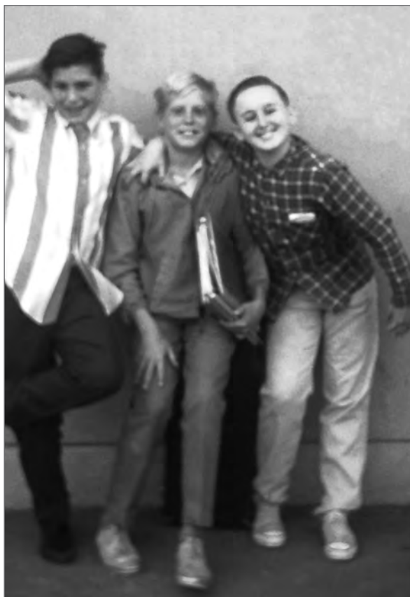
Стів Джобс (зліва) зі шкільними друзями.