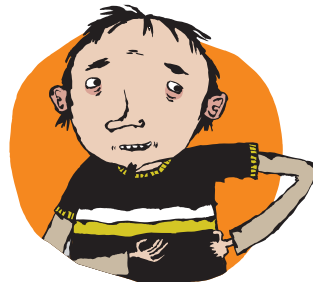
КЛАС, ЧИ ВЧИТЕЛЬ НА ЗАМІНІ