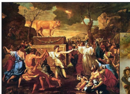
Н. Пуссен. «Танці навколо золотого тельця»

Розглянь репродукції картин. Допоможи Богданові підібрати музику до зображених танців.